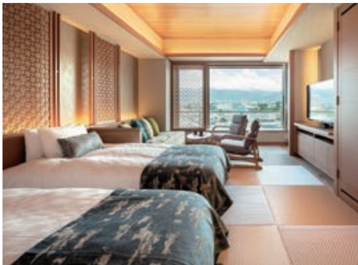
【和モダントリプル】タイプ