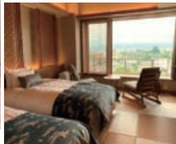
【和モダンツイン】タイプ