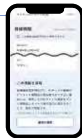
△マイナポータル △ の医療保険の資格情報画面

「資格確認書」、「資格情報のお知らせ」、「資格情報通知書」または「マイナポータル △ の資格情報画面をあらかじめダウンロードしたもの」で代用することができます。