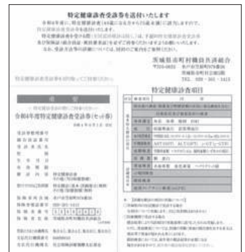
▲特定健康診査受診券 見本

10月中旬に、特定健診を受けていない被扶養者の方へ受診勧奨の通知をお届けしますので、内容を必ず確認してください。