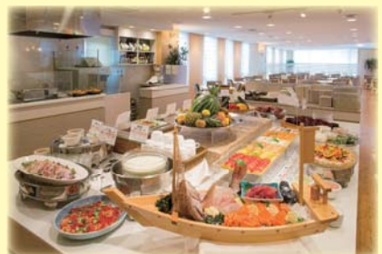
和・洋・中のバイキング