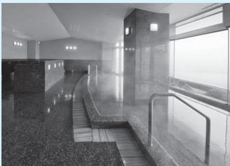
大浴場・内湯(磯の湯)