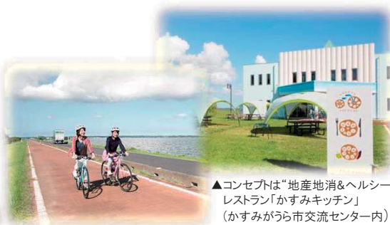
▲コンセプトは“地産地消&ヘルシー” レストラン「かすみキッチン」 (かすみがうら市交流センター内)

▲レンタサイクルで気ままに観光周遊へ。 霞ヶ浦を望みながらのサイクリングは気分爽快。