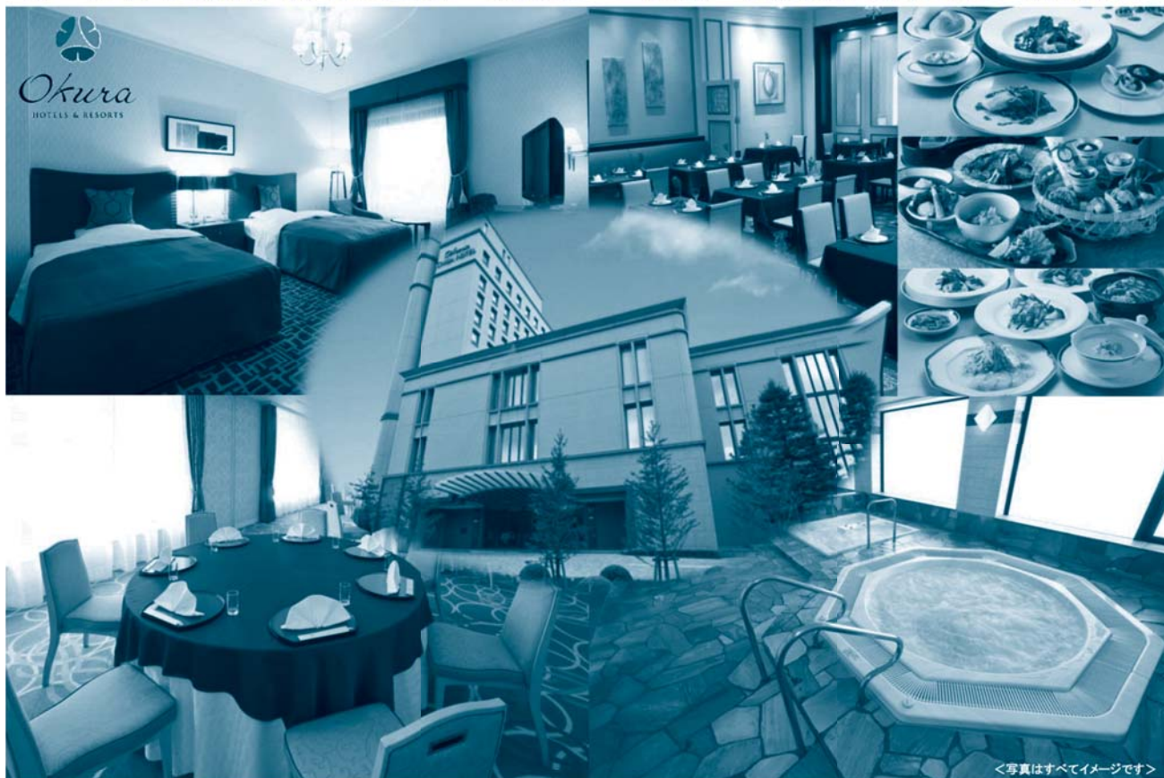
<写真はすべてイメージです>