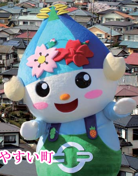
利根町観光協会イメージキャラクター「とねりん」