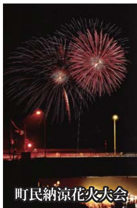
町民納涼花火大会