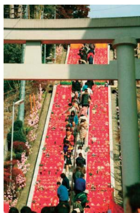
百段階段でひなまつり

高さ120m、幅73mの大きさを誇る袋田の滝は、華厳の滝、那智の滝と並び日本三名瀑の一つに数えられています。また、プロポーズにふさわしい場所として「恋人の聖地」にも認定されている茨城県を代表する観光スポットです。