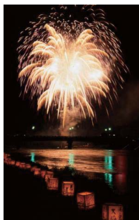
花火大会と灯籠流し

十二所神社の参道にある通称「百段階段」に約1,000体ものお雛様が絢爛豪華に飾られる、一日限りのイベントです。