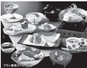
プラン専用コース一例